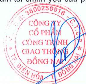
NGÔ ĐỨC TRƯỜNG