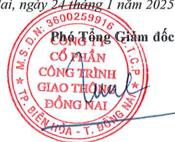
Tôn Đức Tùng