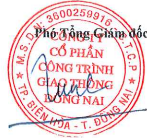
Tôn Đức Tùng