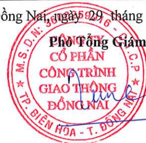
Tôn Đức Tùng