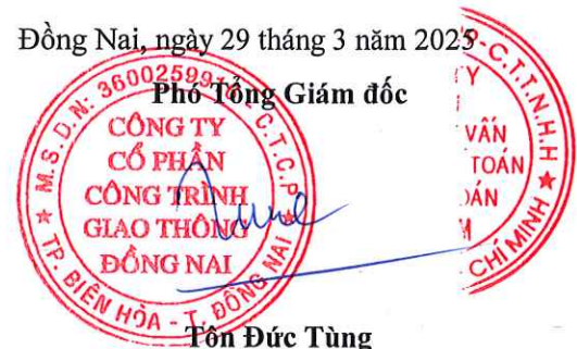
Tôn Đức Tùng